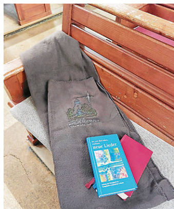
Decken in der Kirche

Wir wollen jetzt schon an die kalte Jahreszeit denken und die „Eisheiligen“ in diesem Jahr haben uns daran erinnert, wie kalt der Winter wieder werden kann. Mit der nächsten bevorstehenden kalten Jahreszeit setzt die ev. Kirchengemeinde ein Zeichen der Fürsorge und Gemeinschaft: Ab sofort stehen den Besucherinnen und Besuchern der Kirche warme Decken zur Verfügung. Die Anschaffung erfolgte, um Gottesdienstbesuche und Veranstaltungen auch in den Wintermonaten angenehmer zu gestalten.