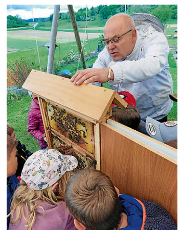
Bienen ganz nah

Im Anschluss konnten die Kinder ein kleines Bienenvolk in einem „Schaukasten“ durch eine Plexiglasscheibe beobachten. Völlig gefahrlos standen die Kinder ganz nah an den Bienen und waren begeistert, sie einmal so intensiv beobachten zu können. Die Königin wurde fleißig gesucht und natürlich viele Fragen gestellt.