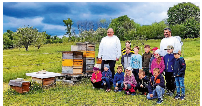
Die „Großen“ am Bienenstand