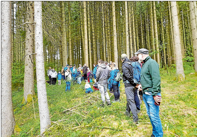
An der Doline unter dem Schnaitkapf gab es auch gleich noch Wissenswertes zu Waldmeister und seiner Verwendung.

Danach ging es weiter Richtung Irndorfer Hardt, mit mehreren kurzen Stopps, an denen es jedes Mal Wissenswertes zu verschiedenen Kräutern entlang des Weges gab. Über die Knoblauchrauke, Giersch und Löwenzahn bis hin zum Spitzwegerich, der auch gleich bei einer Schürfwunde angewendet werden konnte, war es sehr vielfältig und interessant.