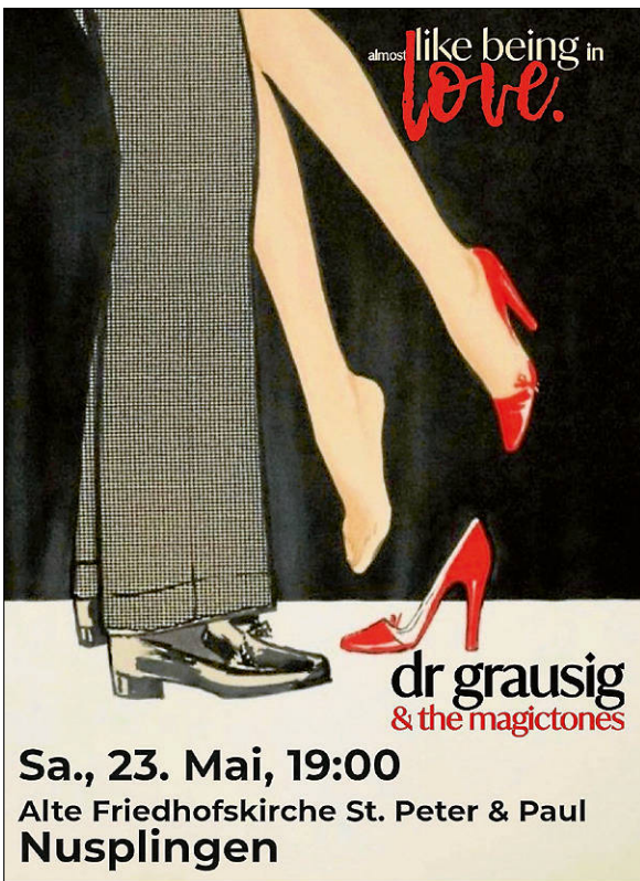
Plakat: Förderverein Alte Friedhofskirche St. Peter und Paul e. V.