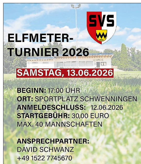
Plakat: SV Schwenningen