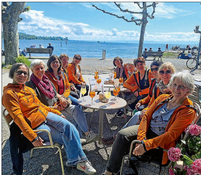
Gruppe „Jazz & Fitness“ nach gelungenem Tanzauftritt.