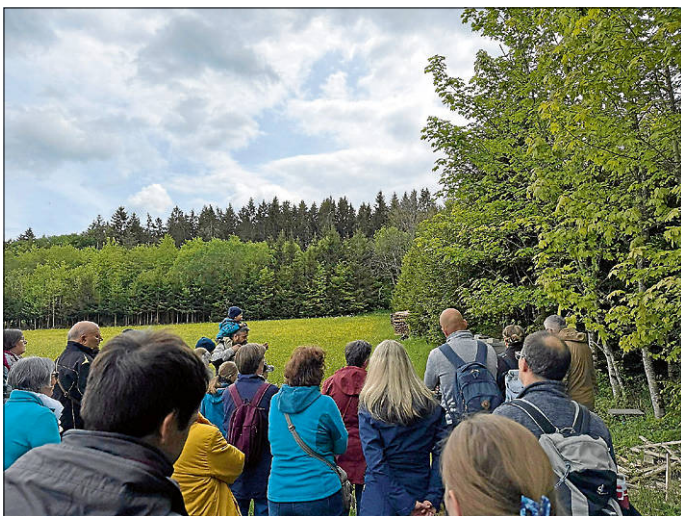
Gespannte Blicke auf das Treiben an den Fluglöchern ...

Die vorletzte Station bildete ein Besuch am Bienenstand. Mit freiem Blick auf den regen Betrieb an den Fluglöchern gab es hier noch einige Infos zum Aufbau des Bienenvolkes, das Leben einer Arbeitsbiene, aber auch verschiedene Honigarten und Propolis.