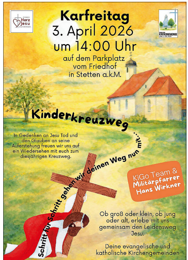
Plakat: Ev. Kirchengemeinde