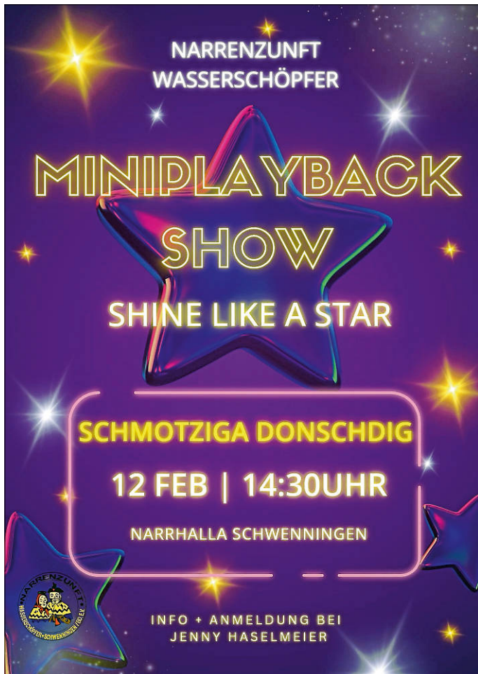
Plakat: Wasserschöpferzunft Schwenningen e. V.