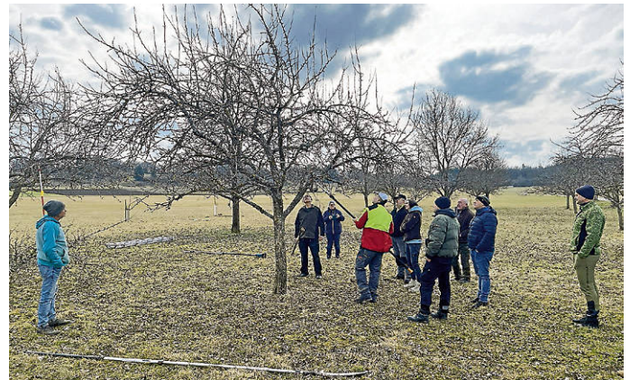
Baumansprache mit dem Kursleiter Herbert Voggel

von einer Bestäubung abhängig. Die jährliche Bestäubungsleistung der Bienen im Obst- und Gemüsebau wird auf 300-500 Mrd. Dollar geschätzt. Gleichzeitig bilden Obstbäume eine wichtige Pollen- und Nektarquelle für die Biene.