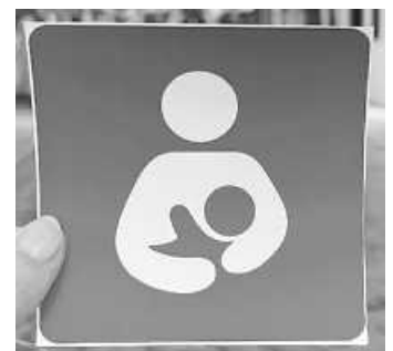
Ein spezieller Sticker kennzeichnet teilnehmende Orte im Landkreis Sigmaringen als still- und babyfreundlich.

Vor allem unterwegs kann das Stillen zu einer echten Herausforderung werden: Viele Mütter fühlen sich in der Öffentlichkeit beobachtet, befürchten unangemessene Reaktionen oder finden es schwierig, geeignete Rückzugsorte zu finden. Deshalb setzt sich das Familiengesundheitszentrum des Landkreises Sigmaringen dafür ein, still- und babyfreundliche Orte zu schaffen – mit zunehmendem Erfolg. Mehr als 25 solcher Orte sind inzwischen in einer interaktiven Karte und auf einer Übersicht des Landkreises zu finden.