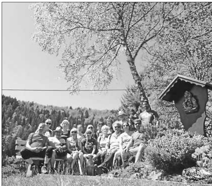
Erwachsenentour mit 16 Teilnehmern