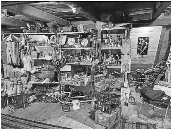
Im Dachgeschoss des Gebäudes wird die Fülle und Vielfalt an unverkaufter Ware im Kaufhaus Pfeiffer besonders deutlich sichtbar.

Das Kaufhaus Pfeiffer aus Stetten am kalten Markt zählt unbestritten zu den spannendsten Gebäuden im Freilichtmuseum Neuhausen ob Eck. Vor genau hundert Jahren wurde das Bauernhaus in ein ländliches Kaufhaus umgebaut. Das Jubiläum „100 Jahre Kaufhaus Pfeiffer“ würdigt das Museum mit einer großen Geburtstagsfeier am Sonntag, 25. Mai, ab 11 Uhr. Neben Grußworten und einem Konzert der Feuerwehrkapelle Stetten am kalten Markt (gegen 11:30 Uhr) lockt ein buntes Programm rund ums Gebäude.