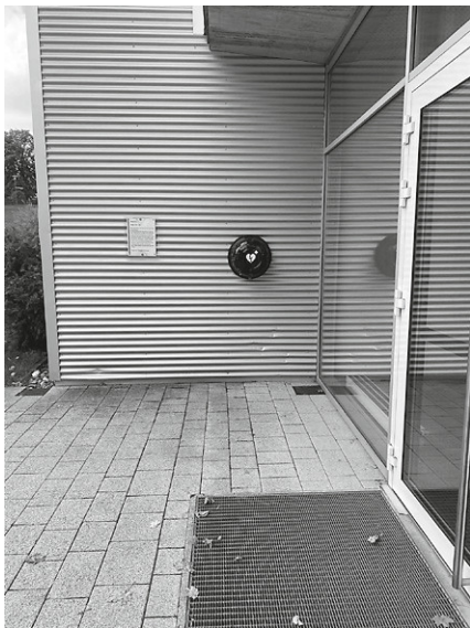
Defibrillator vor dem unteren Heuberghallen Eingang

Wir möchten Sie nochmals darüber informieren, dass in unserer Gemeinde drei Defibrillatoren öffentlich zugänglich sind: