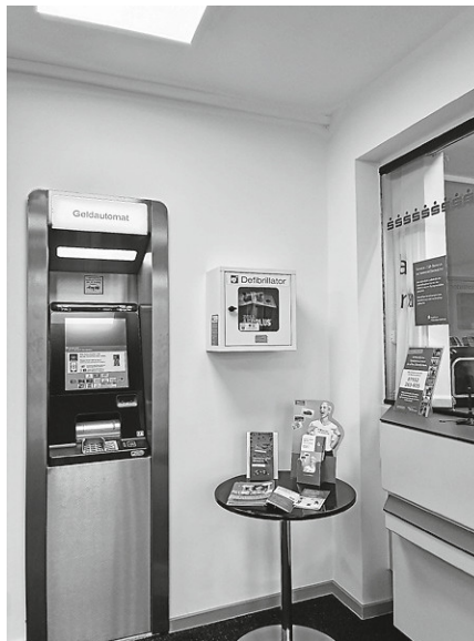
Defibrillator in der Sparkasse