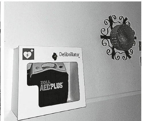
Defibrillator Weinhaus Unger