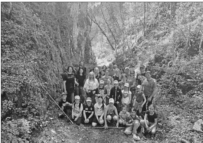
Familientour mit 32 Teilnehmern

Nach einer Stärkung gab es für die Kinder noch einen Stationslauf . Bei Sackhüpfen, Eierlauf, Dosenwerfen, Edelsteinen ausbuddeln und noch vielem mehr hatten die Kinder sichtlichen Spaß und scheinbar noch ausreichend Kräfte übrig.