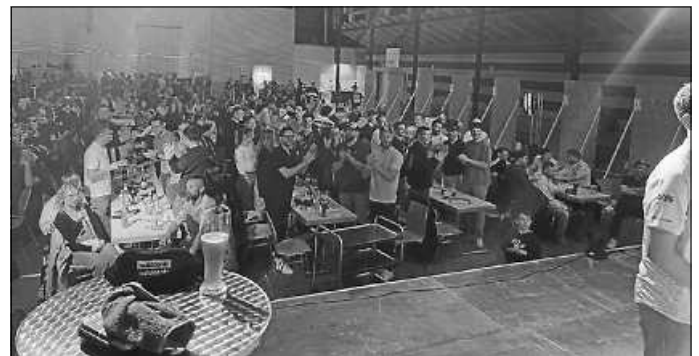
Das Bild zeigt die gut gefüllte Heuberghalle