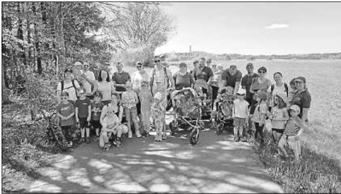
Kinderwagenrunde mit 38 Teilnehmern