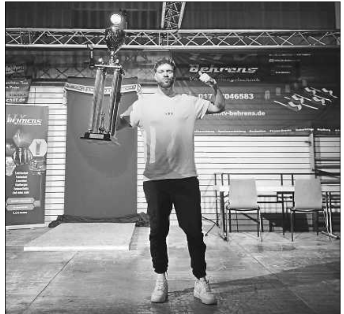
Das Bild zeigt den Turniersieger zusammen mit dem Wanderpokal

Der Sportverein Schwenningen möchte sich an dieser Stelle ganz herzlich bei allen Dart-Spielern, Zuschauern, den vielen Helfern und den Sponsoren bedanken. Wir hoffen, dass wir diese Veranstaltung im nächsten Jahr wiederholen werden.