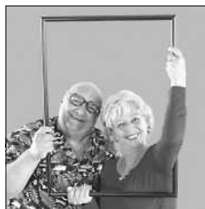
Schwäbische Comedy vom allerfeinsten

Die Kächeles begeistern mit trefflich charakterisierten Figuren und umwerfender Situationskomik. Ihre mitten aus dem Leben gegriffenen Dialoge sprühen nur so vor frechen Pointen. Die Kächeles – zwei Schwaben, die nicht miteinander, aber auf gar keinen Fall ohne einander können. Das schwäbische Comedy-Duo steht für kabarettistischen Hochgenuss und ein Pointenfeuerwerk der Extraklasse!