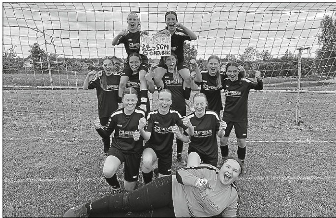
Das Bild zeigt die C-Juniorinnen nach dem Gewinn der Meisterschaft.