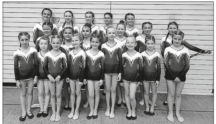
Gruppenfoto Wettkampfgymnastik TVS

Sportliche Grüße und Glückwünsche, euer TV Schwenningen