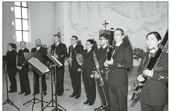
Diese neun Frauen und Männer begeisterten die rund 400 Zuhörerinnen und Zuhörer am Dienstagabend in der St.Kolumban-Kirche mit ihrem Kammermusikonzert.