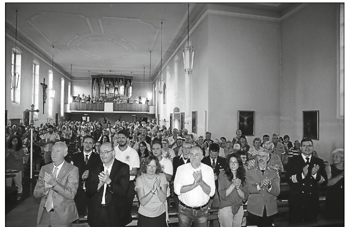
Mit viel Beifall bedankten sich die Besucherinnen und Besucher abschließend bei den Künstlerinnen und Künstlern des Marinemusikkorps Wilhelmshaven.