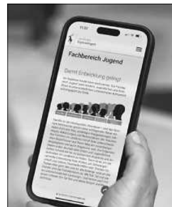
Benutzerfreundliche Gestaltung, klare Struktur: Der Fachbereich Jugend des Landkreises Sigmaringen hat seine Internetseiten grundlegend überarbeitet.

Um Familien, Kindern und Jugendlichen den Zugang zu passenden Angeboten und Anlaufstellen im Landkreis Sigmaringen zu erleichtern, hat der Fachbereich Jugend des Landratsamts gemeinsam mit dem Fachbereich Gesundheit seinen Internetauftritt modernisiert. Dank einer benutzerfreundlichen Gestaltung und einer klaren Struktur lassen sich die vielfältigen Unterstützungsangebote nun noch schneller und einfacher finden.