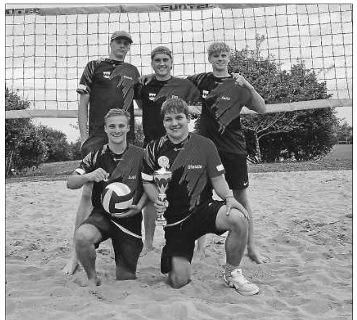
Turniersieger Beachturnier Heinstetten