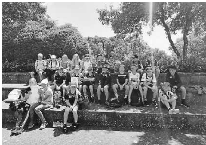
Müde, aber zufrieden: Lächeln für das Abschlussfoto.

„Es war eine schöne Stimmung im Stadion“, zeigte sich Sportlehrerin Nadja Baldischwiler mit dem Tag zufrieden. „Unsere Kids haben viel Spaß gehabt und ihr Bestes gegeben, dazu noch super Wetter gehabt!“