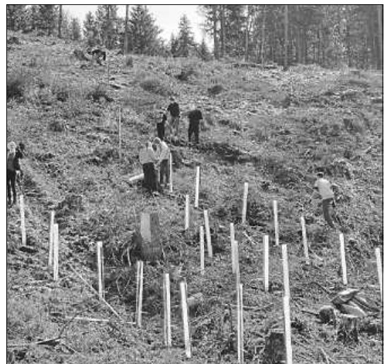
Schwieriges Gelände: die 9.2 arbeitet auf einer unwegsamen Steillage