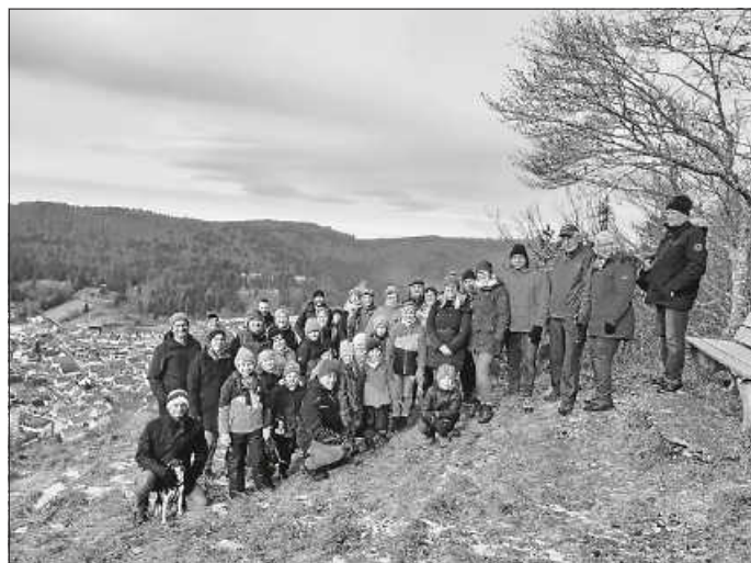
Gruppenfoto auf dem Breiten Felsen