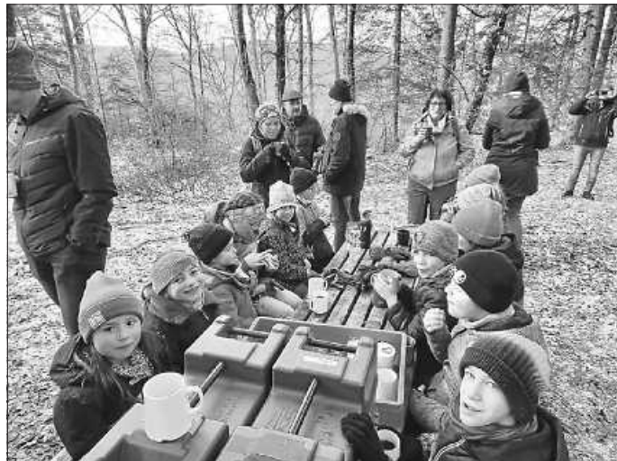
Die Kinder genießen die Pause auf dem Breiten Felsen.