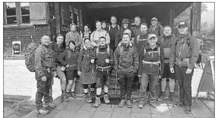
Vor der Schwarzwasserhütte