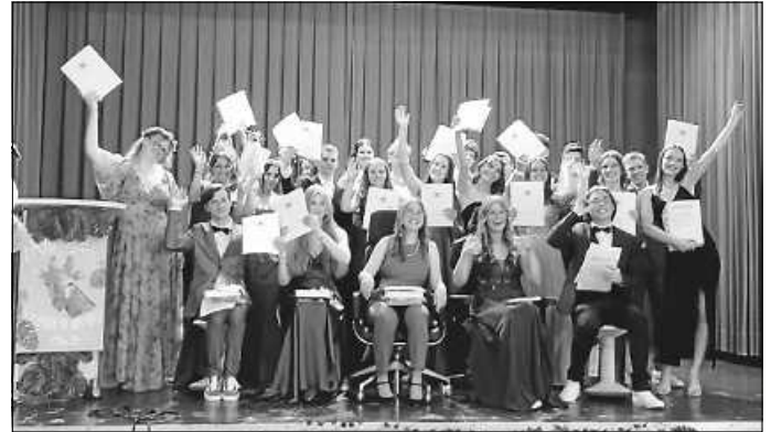
Der Abiturjahrgang des Gymnasium Meßstetten feiert die bestandene Prüfung.