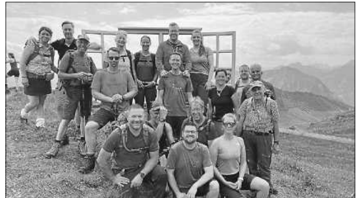
Auf dem Gipfel