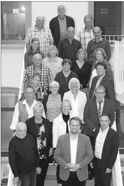
19 Mitarbeiterinnen und Mitarbeiter aus ganz unterschiedlichen Bereichen des Landratsamts werden in den Ruhestand verabschiedet.

Bei einer Feierstunde im Landratsamt hat Landrätin Stefanie Bürkle 19 Mitarbeiterinnen und Mitarbeiter in den Ruhestand verabschiedet. Dabei würdigte sie ihren häufig jahrzehntelangen Einsatz für den Landkreis und im Dienste der Bürgerinnen und Bürger. Darüber hinaus zeichnete die Landrätin mehrere Mitarbeitende für 25 beziehungsweise 40 Jahre im öffentlichen Dienst aus.