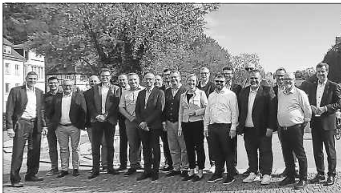
Vor der Kulisse des Hohenzollernschlusses tagten die Mitglieder des Ausschusses für Planung und Klimaschutz des Verbands Deutscher Verkehrsunternehmen (VDV) in Sigmaringen.

Der Ausschuss für Planung und Klimaschutz beschäftigt sich mit allen Aspekten eines nachhaltigen Verkehrsangebots. Seine Mitglieder sind die Spitzen von ÖPNV-Unternehmensleitungen und Experten in der Mobilitätsplanung. Der VDV vertritt die Interessen von rund 600 Mitgliedsunternehmen, die sich für die Förderung und Weiterentwicklung eines leistungsfähigen und umweltfreundlichen Verkehrssystems in Deutschland einsetzen.