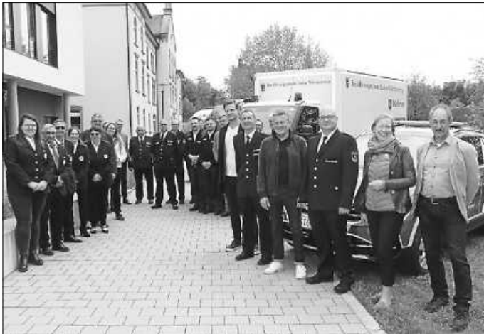
Vertreter des Landkreises, der Kommunen und der Bevölkerungsschutzeinheiten kommen bei der Übergabe der vier neuen Fahrzeuge vor dem Landratsamt zusammen.

zeit gute Fahrt und jederzeit gesunde Rückkehr von den Einsätzen und Übungen. Zudem nutzte sie die Gelegenheit, sich persönlich bei den Helferinnen und Helfern für ihren unermüdlichen Dienst für die Allgemeinheit zu bedanken.