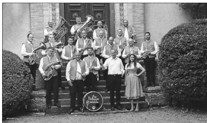
Ein Ensemble der Spitzenklasse