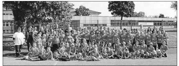
Am Mädchenfußballtag nahmen die Erst- bis Fünftklässler teil.