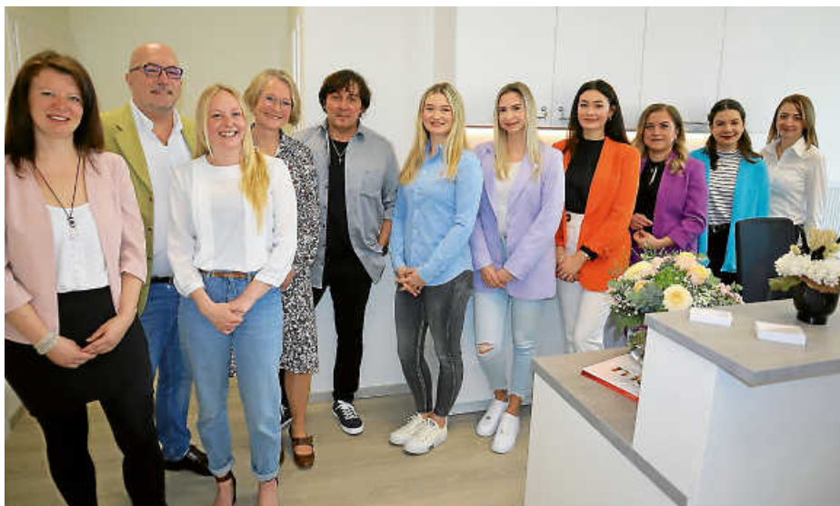
Das Team der beiden Ärzte stellte sich bei der Übernahme der Arztpraxis zum Gruppenfoto.

Nach einem gemeinsamen Gebet und der Segnung der Räume und der beiden VERAHmobils fand die Feierlichkeit mit einem gemeinsamen Mittagessen im „Gasthof Adler“ ihren Abschluss.