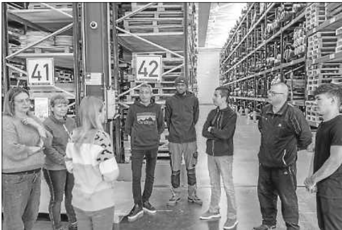
Zum Auftakt der Projektreihe „Tage der Vielfalt“ informieren sich Geflüchtete in Scheer über die Karl Späh GmbH & Co. KG.