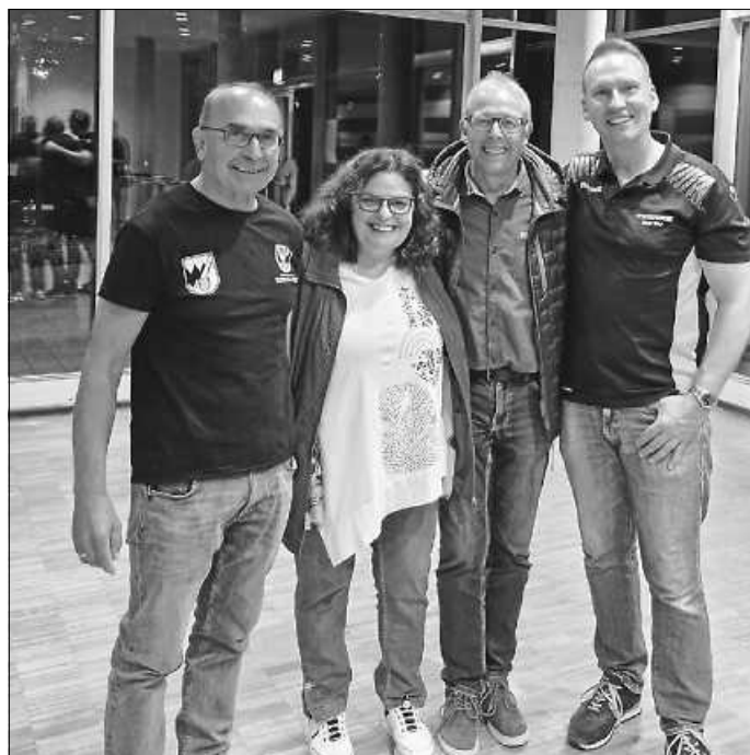
Hillu's Herzdropsa nach der Show