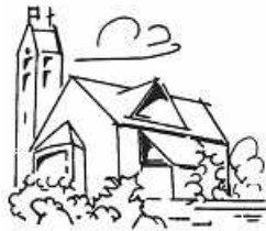
St. Jakobus Hartheim

Herzliche Einladung zu unserem Patroziniums-Festgottesdienst am 14. Juli 2024 um 09:00 Uhr in unserer Kirche St. Jakobus. Der Festgottesdienst wird mitgestaltet von dem Musikverein und dem Gesangverein Hartheim.