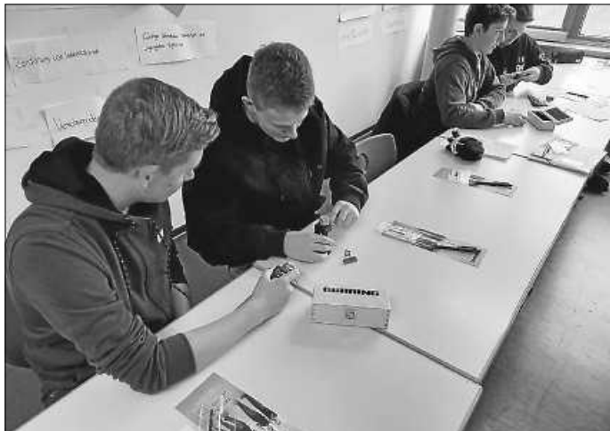
Praktische Übungen veranschaulichen die Vorträge.

Die Ausbildungsbörse stößt auf regen Zuspruch unter den Lernpartner:innen, die erste Kontakte für Praktika knüpfen können oder ihrem Wunschberuf an diesem Tag ein Stückchen näher gebracht werden.