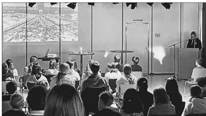
Schüler und Schülerinnen des Gymnasium Meßstetten gedenken den Opfern des Nationalsozialismus

Zur Trauer um all jene, deren Leben und Zukunft genommen wurde, aber auch um Intoleranz, Hass und Ausgrenzung aktiv entgegenzutreten. Sie als junge Generation, so der 12.Klässler, seien nun in der Verantwortung, ihren Blick auch auf die Gegenwart zu richten.