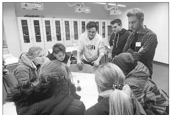
Die Fachräume der GMS sind flexibel gestaltbare Lernumgebungen.

Gelebte Vielfalt ist an der Gemeinschaftsschule Stetten nicht nur fachliches Curriculum. Mit einer multikulturellen Aufführung von Songs aus vier verschiedenen Ländern umrahmten Bläserklasse und Grundschulchor die Auftaktveranstaltung zu einem abwechslungsreichen Nachmittag mit Mitmach-, Vorführ- und Informationsangeboten. Die GMS präsentierte ein umfangreiches Bildungsprogramm mit Lernen auf drei Niveaustufen, digitaler Unterrichtsgestaltung sowie den Bildungsbereichen Beruforientierung (BO) und Informatik, Mathematik, Physik (IMP). Als zertifizierte Schule mit bewegungserzieherischem Schwerpunkt kann sie einen Bikepool und zahlreiche Sportaktivitäten anbieten. Einen weiteren Pluspunkt bietet die konzeptionelle Verzahnung der integrierten Grundschule mit der Sekundarstufe I, die die Schüler*innen auf das methodische Arbeiten in den höheren Lernstufen zielführend vorbereitet. Sozial unterstützende Aktivitäten stellen Schulsozialarbeit und Schulseelsorge mit einem ausdifferenzierten Sozialcurriculum bereit.