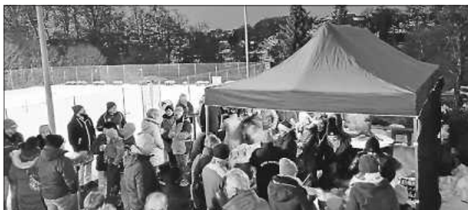
Gesang, Genuss, Gemütlichkeit

Zahlreiche Gäste folgten unserer Einladung und erfreuten sich am Gesang des MGV Eintracht, an Punsch und Crêpes sowie an Glühwein und Wurst im Wecken. Richtig gemütlich wurde es dann in unserem warmen, weihnachtlich dekoriertem Clubheim. Hier klangen die Lieder des MGV noch bis in den späten Abend hinein. Herzlichen Dank an alle Helfer und Partner, an den MGV Eintracht und an alle Gäste.