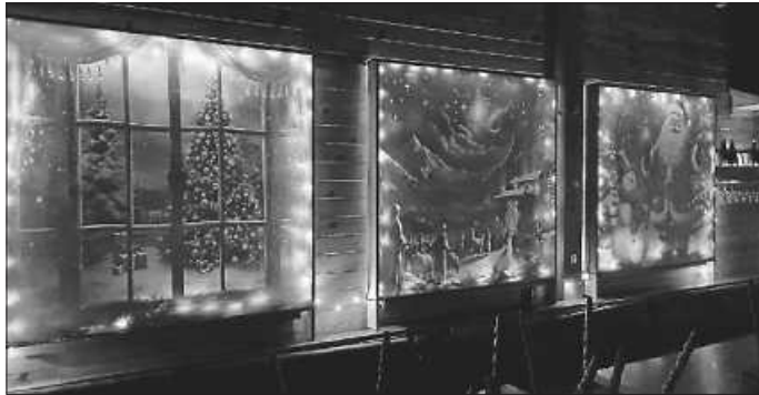
Weihnachten im Auge des Betrachters

Am Sonntag, den 10. Dezember 2023 öffnete sich das Adventsfenster des TC Schwenningen auf dem Staudenbühl. Das Thema des Motivs lautet: „Weihnachten ist individuell, von klassisch bis speziell“ und zeigt drei von unzähligen möglichen Blickwinkeln auf die Weihnachtszeit. Mit diesem Bild ist uns ein echter Hingucker gelungen. Die Fenster wurden durch die Familien Kittner und Jäger gestaltet, bei denen wir uns recht herzlich bedanken möchten.