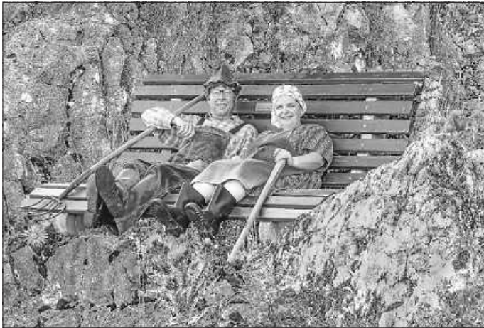
Programm: Sctoi(reiche) ALBSCHWOBA

Geschichten aus ihrem Leben! Situationen, die jeder Zuschauer bereits das ein oder andere Mal in ähnlicher Weise selbst erlebt hat! Hillus Herzdropfa sehen das Leben von der heiteren Seite! Emmr Kuh(l) bleiba!